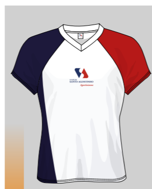
BLUSA BABY LOOK ED. FÍSICA