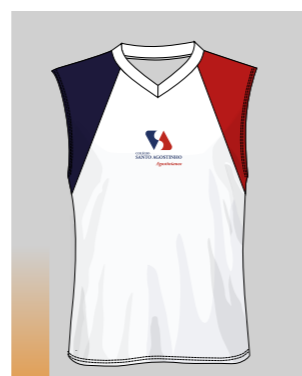
REGATA ED. FÍSICA