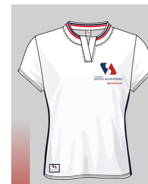
BLUSA GOLA V