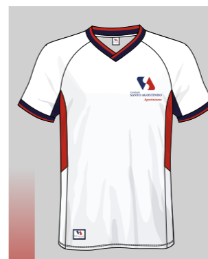
BLUSA MALHA DRY