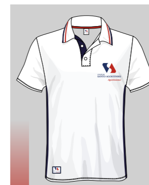
CAMISA GOLA POLO