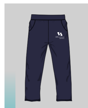
CALÇA TACTEL + CÓS